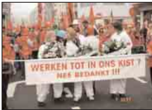
Travailler jusqu'au tombeau ? Non, merci !

Bien que le syndicat chrétien CSC-ACV et les libéraux de la CGSLB-ACLVB aient décidé de ne pas participer à cette action, des centaines de milliers de travailleurs belges ont répondu à l'appel en raison de la fermeté affichée par la FGTB-ABVV pour la défense de la sécurité sociale belge. Les transports et les communications étaient à l'arrêt et la grève a touché des pans entiers des secteurs public et privé. L'ICEM a prêté son soutien dans les jours qui ont précédé la grève.