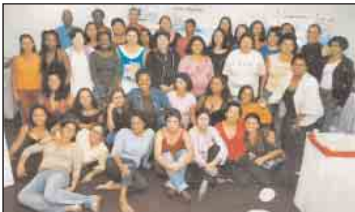
Davantage de femmes doivent être formées à la négociation collective, comme l'ont reconnu toutes les participantes à un récent forum de CNQ/CUT Formaquimulher.

Les besoins des femmes figurent aussi en bonne place dans l'alliance entre l'ICEM et la FIOT pour l'industrie pétrolière et gazière. Un